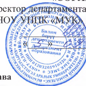
ГРАФИК взаимопосещений занятий профессорско-преподавательского состава кафедры «Регионоведение» на 1-полугодие 2023-2024 учебного года